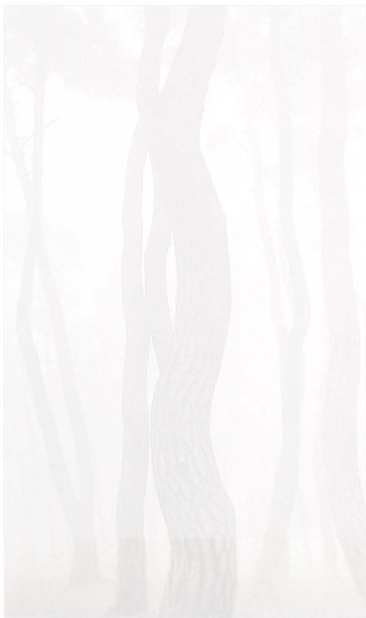
Los bosques protagonizan la serie 'Pine Trees' de Bae Bien-U.

Bae Bien-U. Pine Trees y Wind of Tahiti . Hasta el 23 de julio.